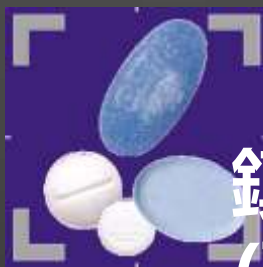
鎮靜劑 (藍精靈、白瓜子等)