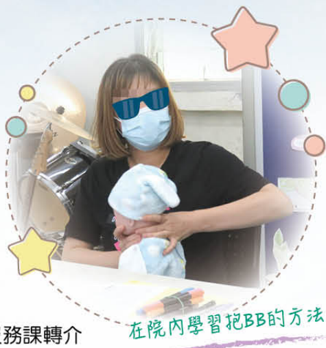
在院內學習抱BB的方法