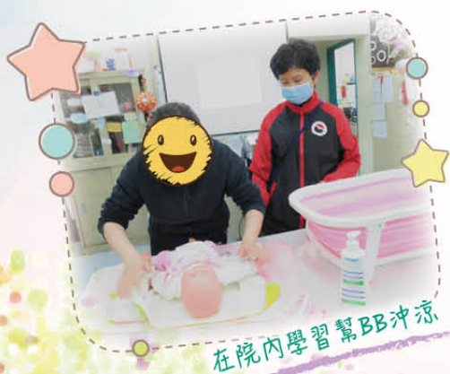
在院內學習幫BB沖涼