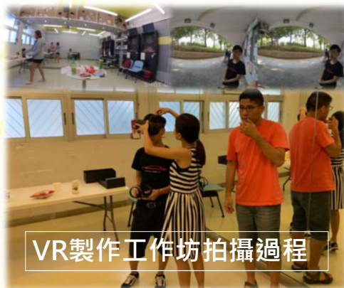
VR製作工作坊拍攝過程

VR為時下年青人新興的玩意，透過認識及製作VR的工作，拍攝有關以禁品為主題的VR影片(360全景影片)。參力者當中也會認識毒品知識之餘，所完成的VR影片會製作成禁毒教育配套之用，以於社區宣揚的禁毒意識。共有 12名青少年參與工作坊 。