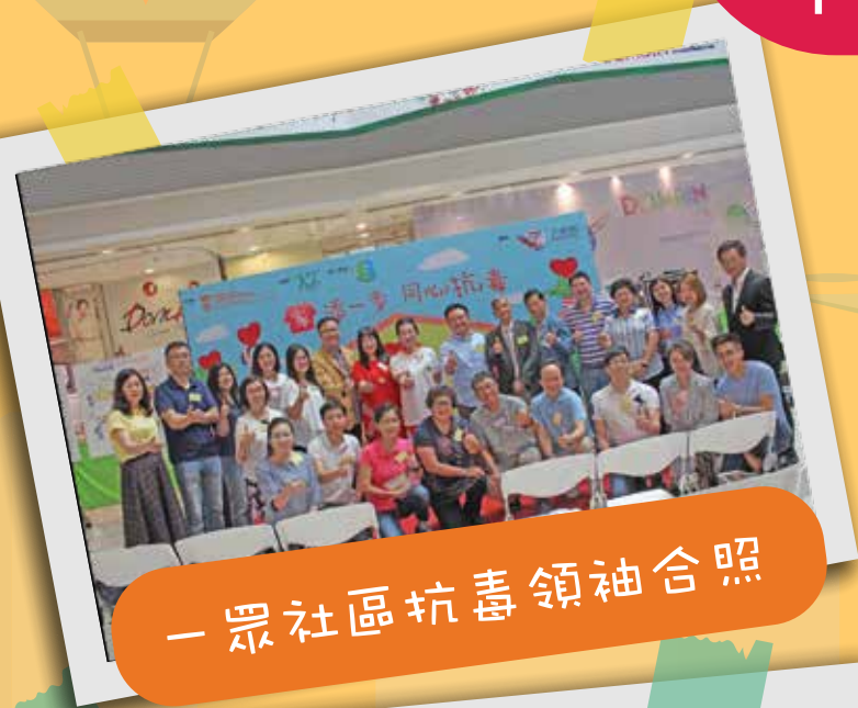
一眾社區抗毒領袖合照