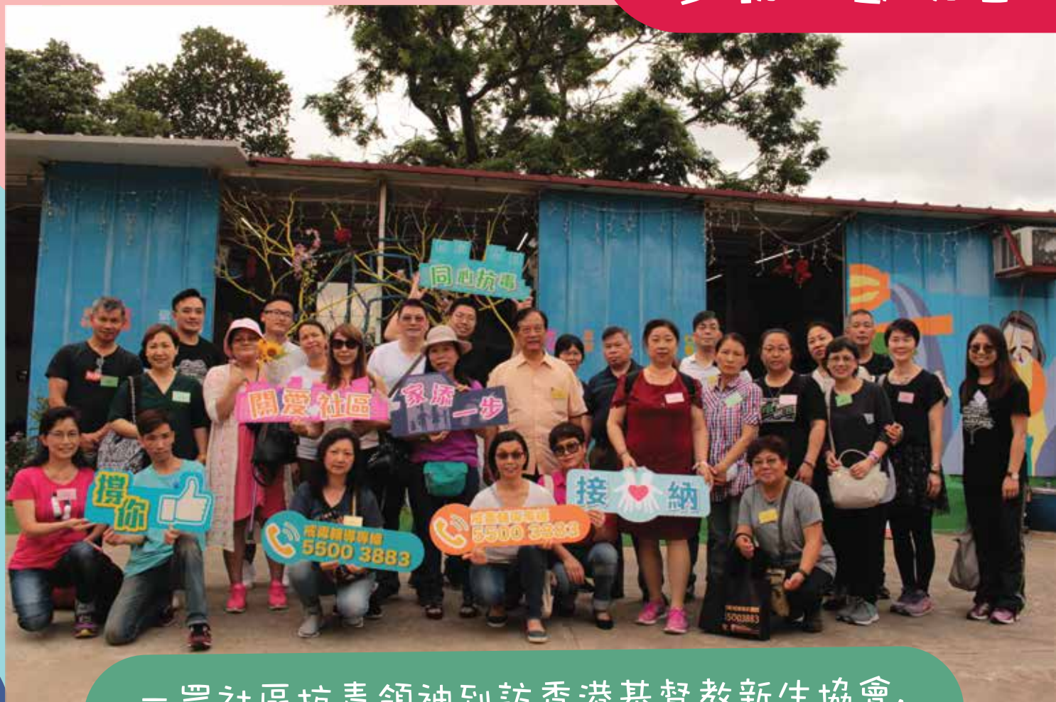
一眾社區抗毒領袖到訪香港基督教新生協會， 認識院舍戒毒服務