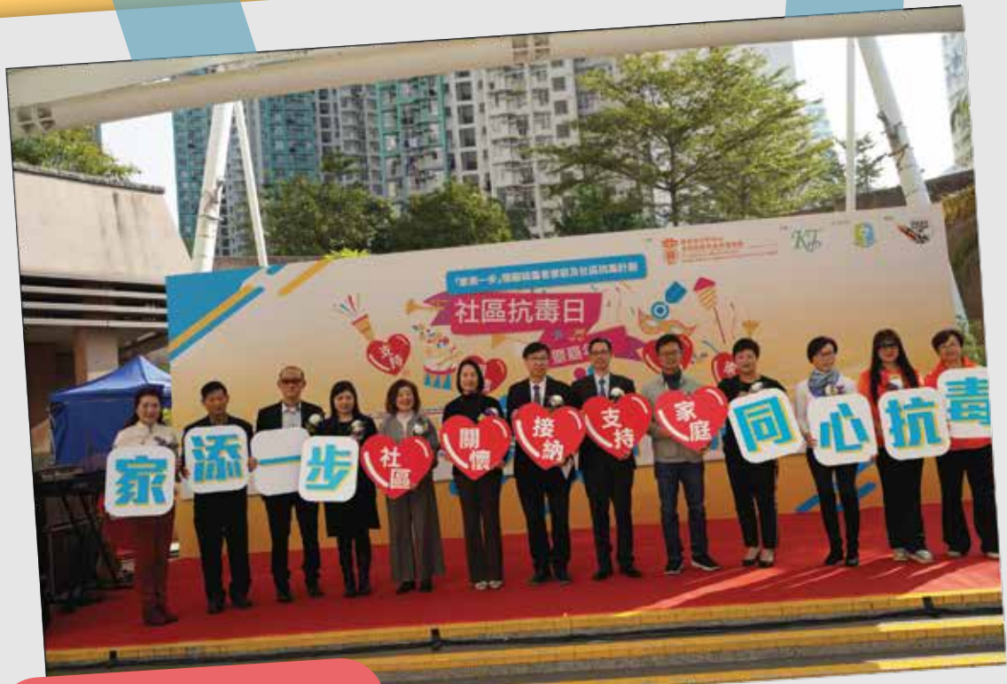
嘉賓同心推廣抗毒資訊