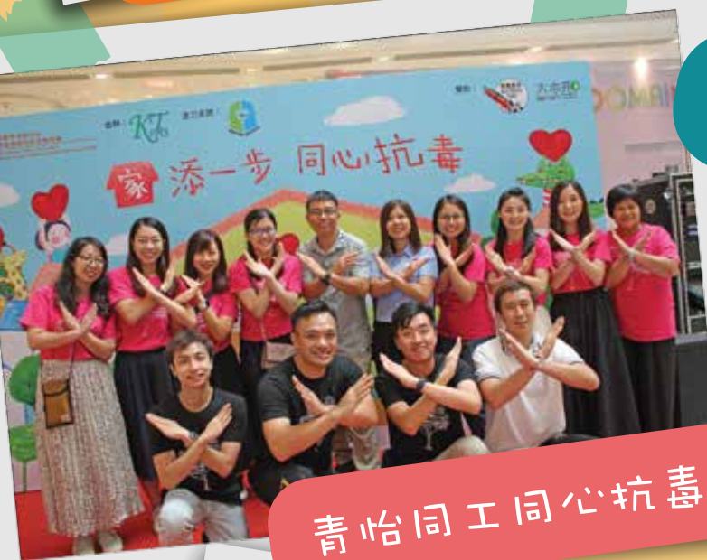
青怡同工同心抗毒