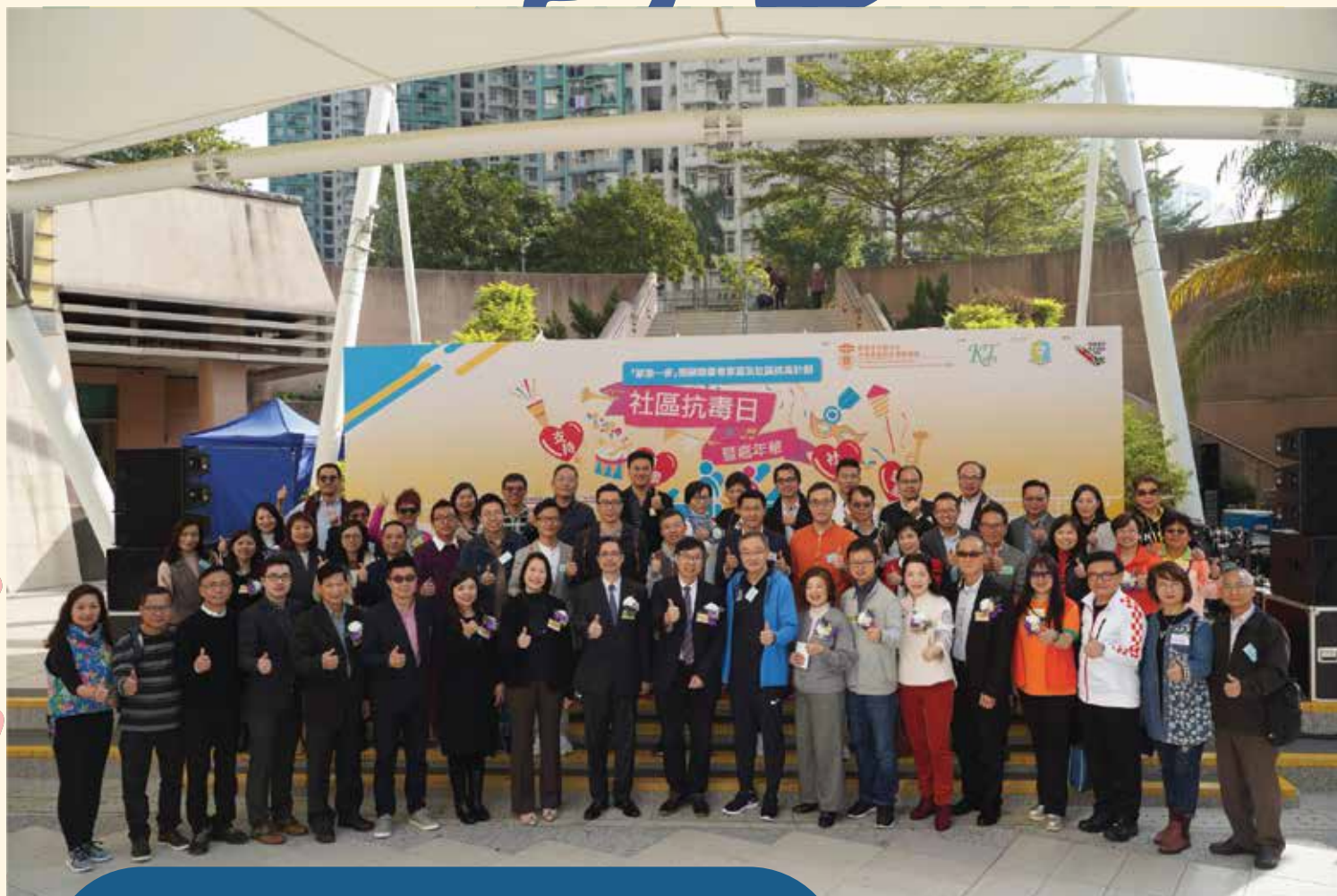
一眾嘉賓、社區抗毒領袖及社區抗毒團隊大合照