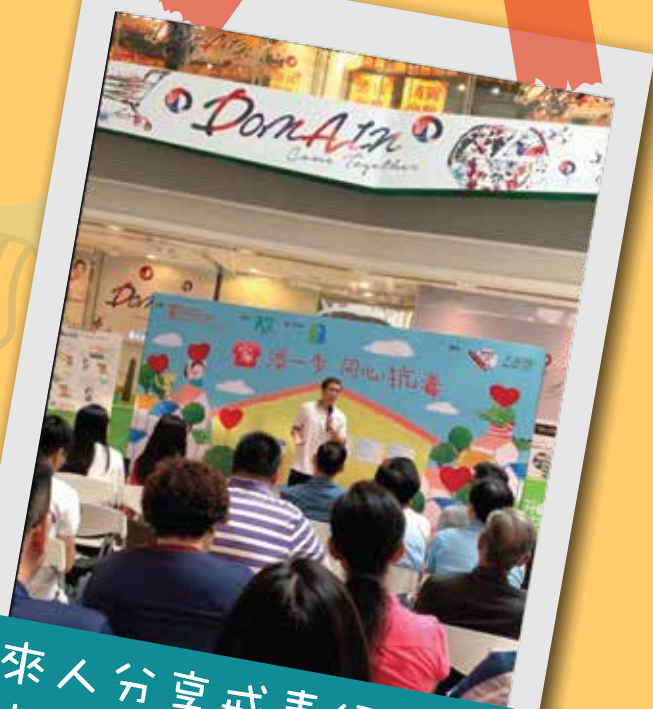
過來人分享戒毒經歷，讓社區人士更明白戒毒者的心路歷程