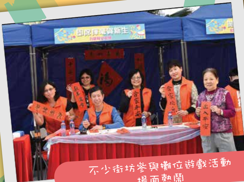
不少街坊參與攤位遊戲活動 場面熱鬧