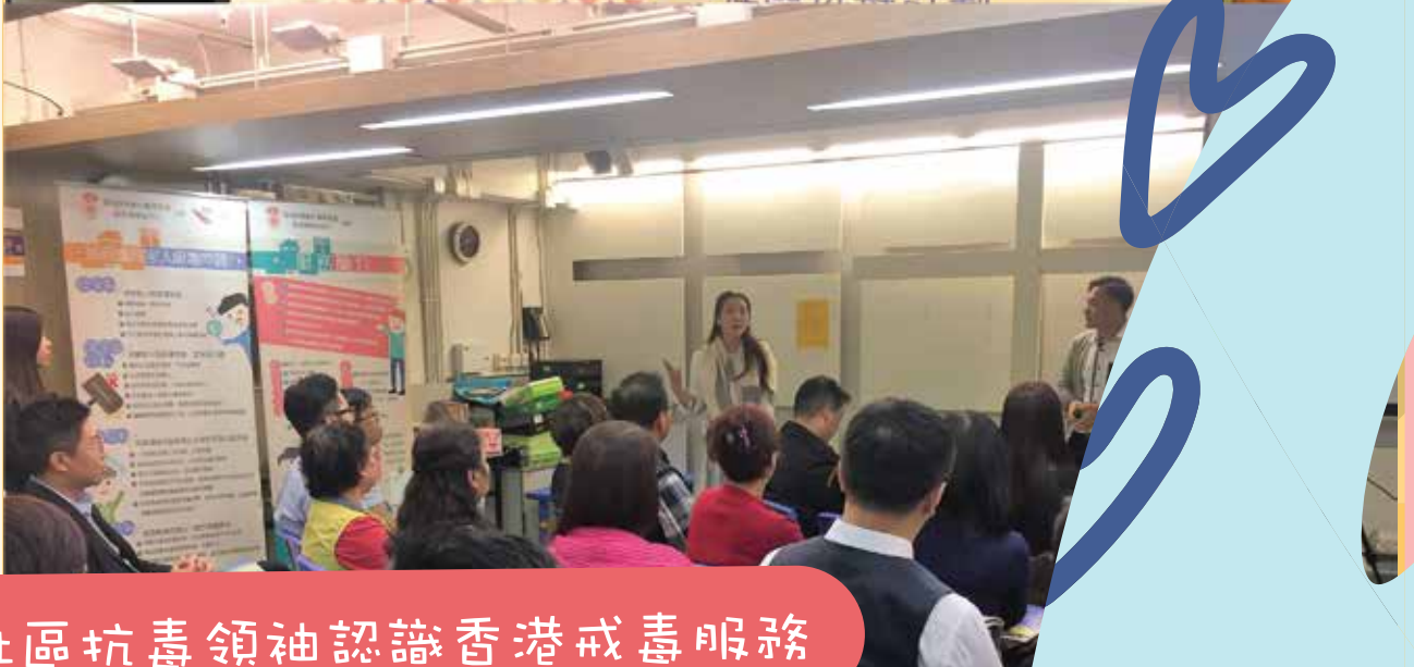
社區抗毒領袖認識香港戒毒服務