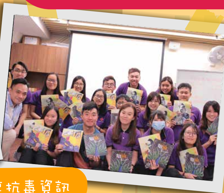
向青年領袖分享抗毒資訊