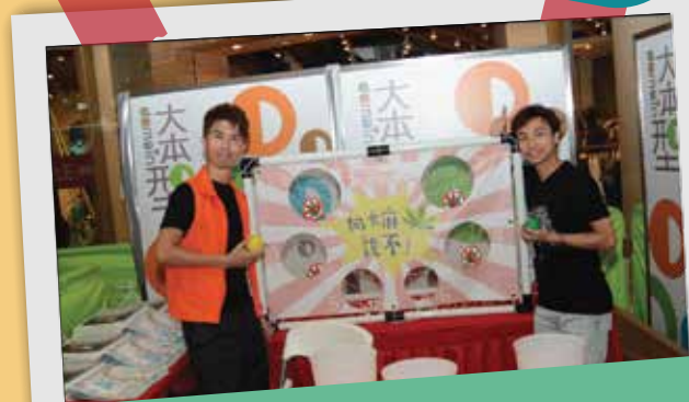
以攤位遊戲推廣抗毒資訊