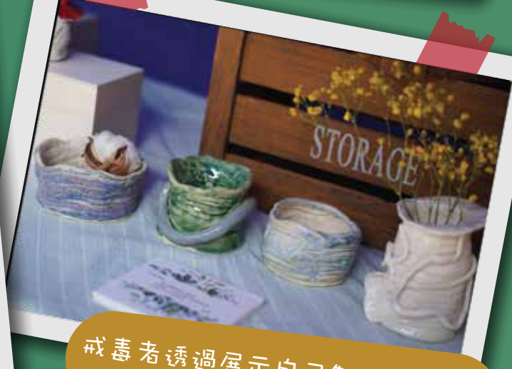
戒毒者透過展示自己製作的藝術品 分享戒毒的心路歷程