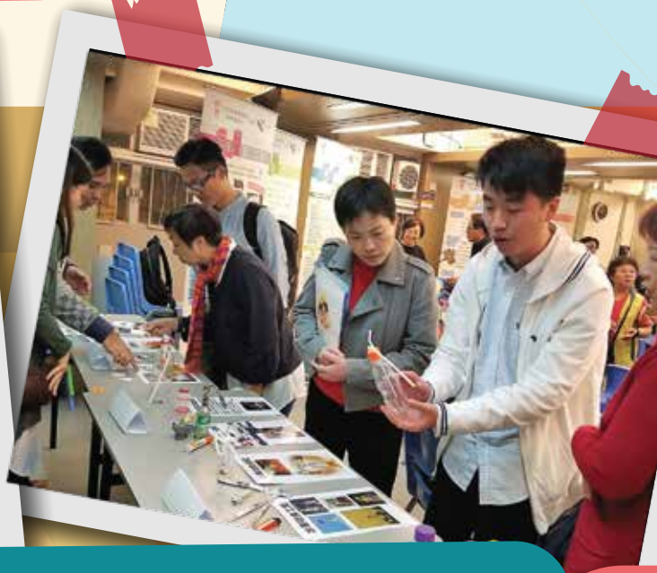
社區抗毒領袖了解毒品對身心的影響