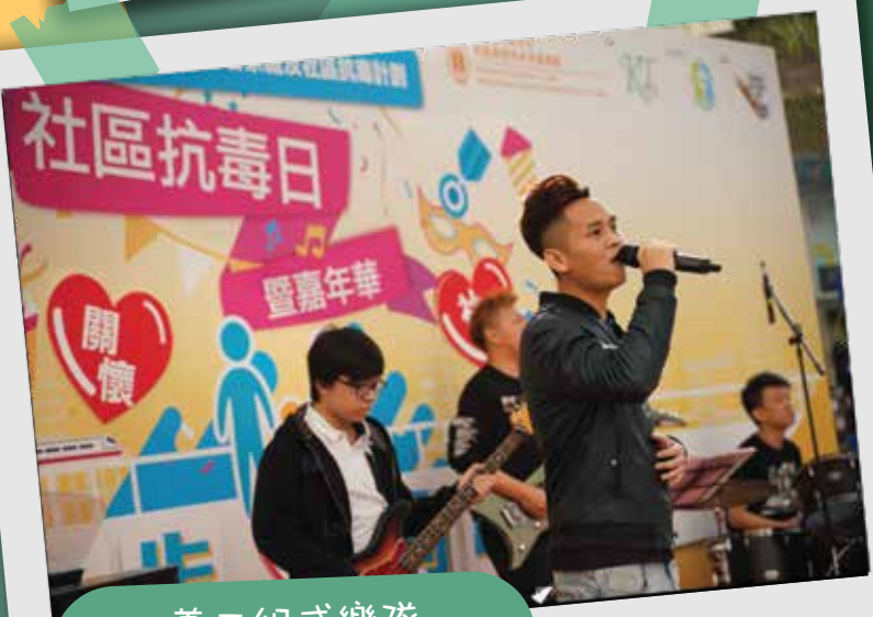
義工組成樂隊 以音樂宣揚抗毒訊息