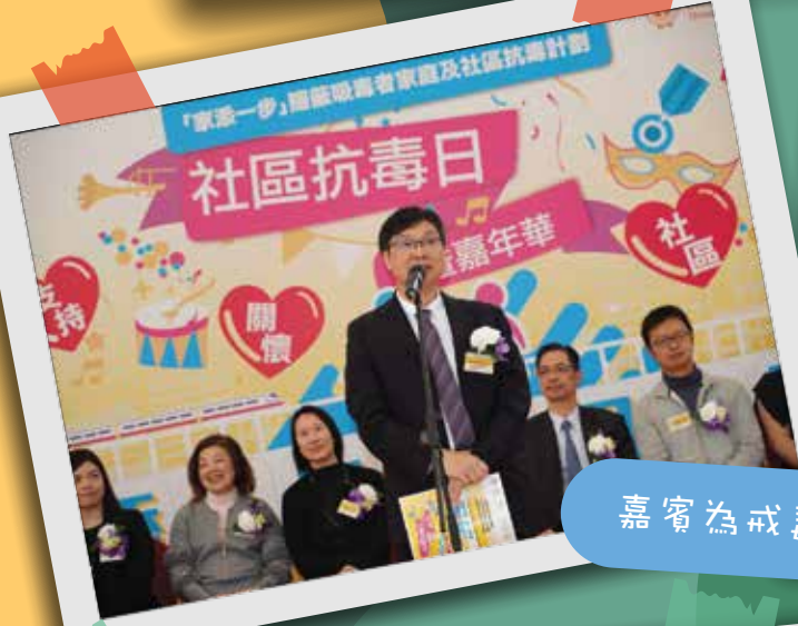
嘉賓為戒毒人士打氣