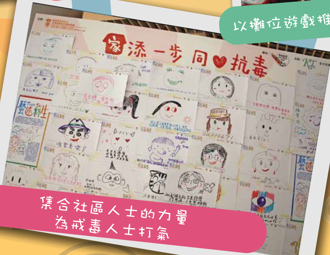
集合社區人士的力量 為戒毒人士打氣