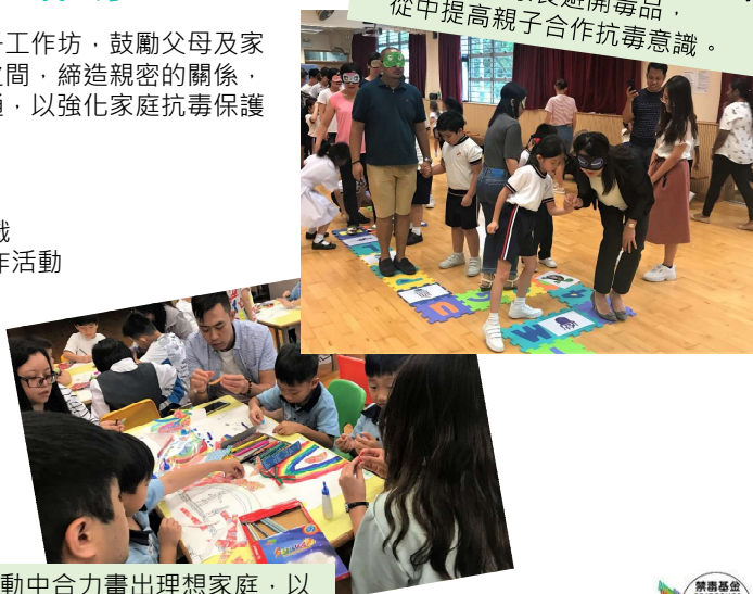
親子在藝術活動中合力畫出理想家庭，以促進溝通、建立信任及強化家庭保護功能。