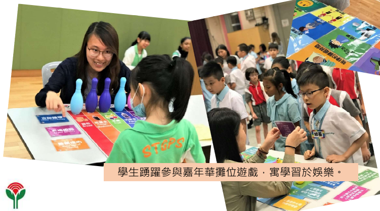
學生踴躍參與嘉年華攤位遊戲，寓學習於娛樂。

舉辦校本攤位遊戲活動，透過輕鬆有趣的遊戲教育學生對毒品、煙酒及健康生活態度的知識。