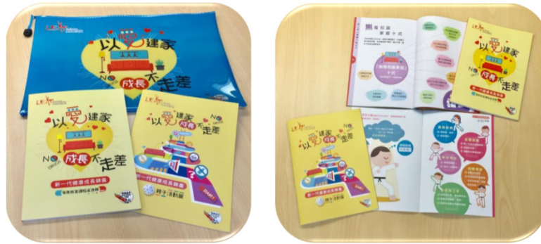
抗毒訊息紀念品及 家長錦囊（家長抗毒資源冊及親子活動冊）