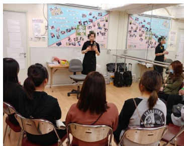
創業及行業發展工作坊