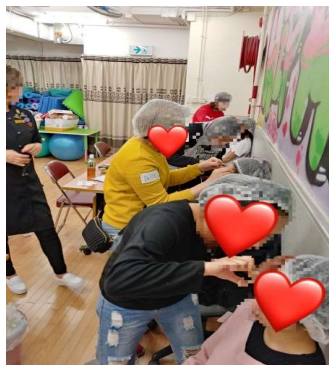
職業技能培訓課程