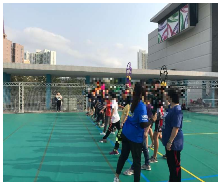
「容圃坊」工作實踐平台