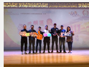
元朗區傑出義工選舉 青少年團體組季軍 (2017及2018)