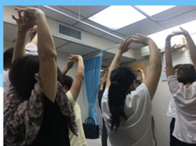
中醫療身養心小組