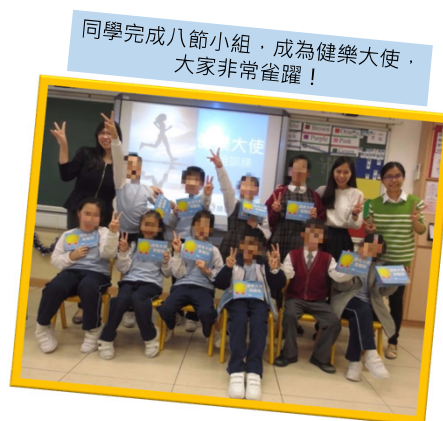
同學完成八節小組，成為健樂大使，大家非常雀躍！