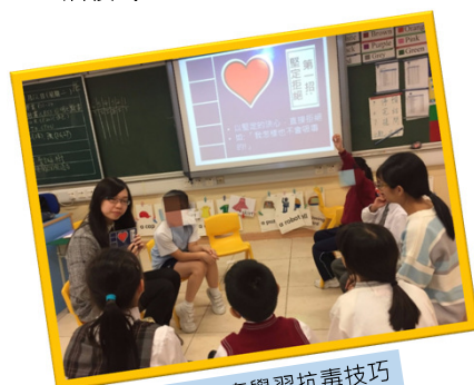
同學認真學習抗毒技巧

透過活動及遊戲中愉快學習，認識社交技巧、情緒管理、毒品知識、建立正確的金錢觀、鞏固拒絕毒品的決心，加強守法意識，自我欣賞及締造健康生活模式。