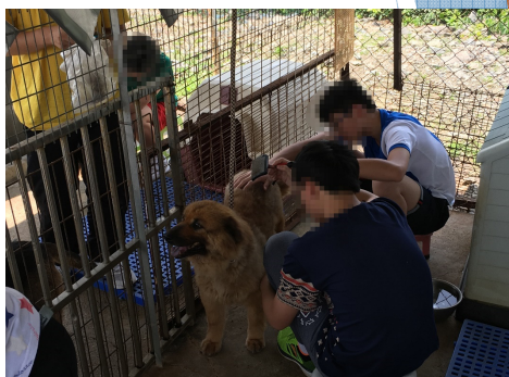
▶ 院舍青年到狗場照顧被遺棄犬隻