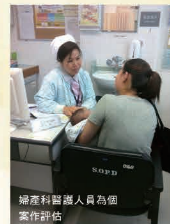
婦產科醫護人員為個案作評估

兒童身心全面發展服務助產士首先與準媽媽們進行面談，了解她們的病歷和社會背景。隨後，兒童身心全面發展服務助產士會在產前檢查中對準媽媽進行持續、深入的心理健康評估，並提供諮詢和輔導以支援母親的產前需要，幫助她們做好為人母的準備。隨後，準媽媽會被轉介給基督教聯合醫院的醫務社工，以進行更詳細的社會支援評估及制定育兒計劃。助產士如發現準媽媽有情緒或精神方面的困擾，她們會被轉介給兒童身心全面發展服務的精神科團隊跟進。在獲得母親的同意後，兒童身心全面發展服務助產士會把母親轉介給路德會青彩 / 青怡中心，將其納入「生命孕記：吸毒家長全人親職輔導、教育及支援計劃」。路德會青彩 / 青怡中心的社工會根據母親的吸毒情況為其提供諮詢及輔導服務，隨後，社會會陪同母親定期約見醫生和助產士，並進行家訪。兒童身心全面發展服務助產士、基督教聯合醫院的醫務社工和路德會青彩 / 青怡中心的社工就母親在醫療方面、情緒方面和藥物使用方面的狀況作緊密溝通。孩子出生後，新生嬰兒將被轉移到嬰兒特別護理部進行觀察。醫護人員（包括兒童及青少年科專科醫生及護士、兒童身心全面發展服務的助產士等）、醫務社工及路德會社工將根據需要，召開兒童及家庭福利會議，以確保兒童出院後能獲得穩定和可靠照顧，並能在無毒的家庭環境下成長。