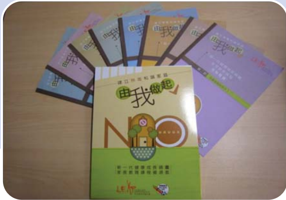
8節課堂筆記及文件夾