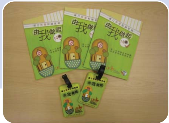
資源冊及抗毒紀念品