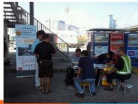
於貨櫃碼頭為司機進行免費身體檢查