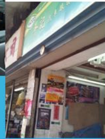
車房協助推廣無毒駕駛訊息