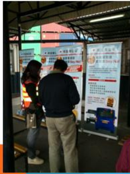
在貨櫃碼頭進行展覽