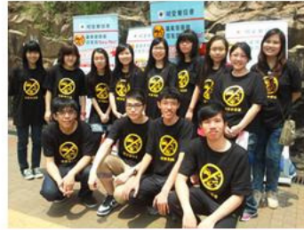
各義工參與推廣活動