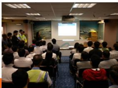
與機場工作的司機進行預防講座