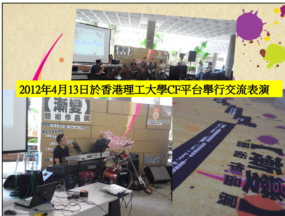
2012年4月13日於香港理工大學CF平台舉行交流表演