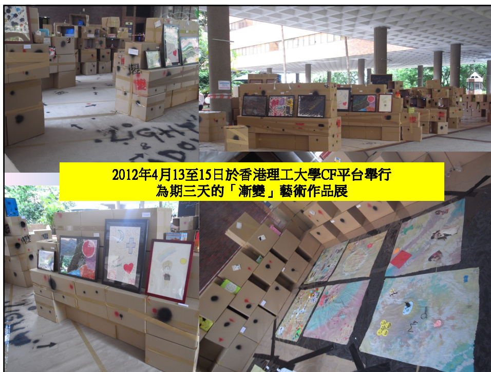
2012年4月13至15日於香港理工大學CF平台舉行為期三天的「漸變」藝術作品展