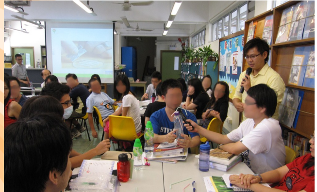
● 本會同工向教師講解如何辨識有吸毒問題的學生。

此課程費用全免，有意者請致電 2551 2880 向本會同工何先生或李先生查詢。