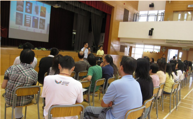
● 本會同工向教師介紹毒品問題的趨勢。