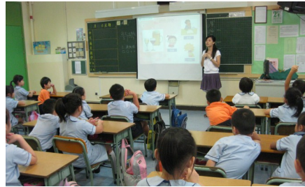
● 本會同工為初小學生提供正確用藥資訊。

「培訓課程提高了我對禁毒教育的認識，且過來人的分享令我很感動，在此感謝各位努力。」