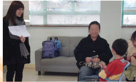
● 本會同工為家長提供禁毒及健康教育服務。