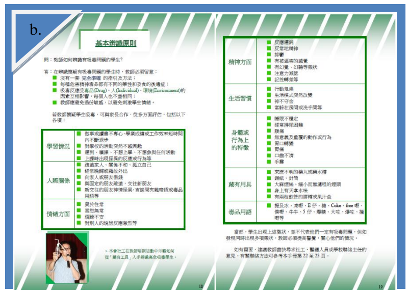
b. 《禁毒教育 教師手冊》內頁，介紹有關的基本辨識原則