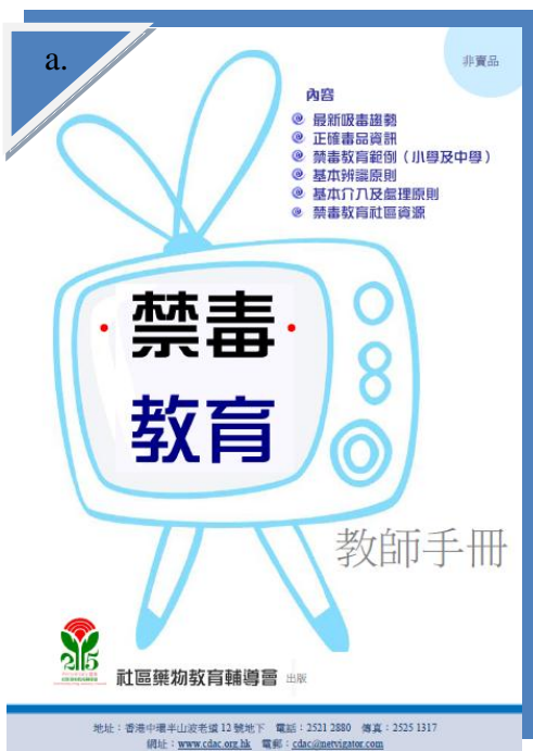
a. 《禁毒教育 教師手冊》封面